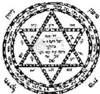
Illustration 1 Amulette

Le corpus de textes magiques juifs ne cesse de s'accroître grâce aux découvertes archéologiques modernes et plus particulièrement grâce aux découvertes effectuées au sein des Manuscrits de la Mer Morte. On peut citer ainsi le fragment 4Q186 qui est un texte hébreu sur la physiognomonie et l'astrologie; le fragment 4QMess qui est sans doute un passage du « Livre de Noé » qui se réfère à la physiognomonie et à la Merkhavah; le 4Q318 qui est un texte araméen portant sur certaines mancies basées sur les orages; le 4Q511-12, le Chant des Sages qui protège contre les démons; le 4Q560 qui est un fragment araméen d'incantations apotropaïques et quelques exorcismes dans 11QPsaumes.